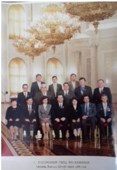
IV Всесоюзный съезд колхозников г.Москва, Кремль, 23-25 марта, 1988 года